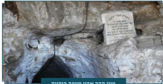
ציון קבר אביי מושב ברייה

שילב תוכחה מוסרית עמוקה באמרותיו. דרש: "לא חרבה ירושלים אלא בשביל שחיללו את השבת" (שבת ק"ט ע"א).