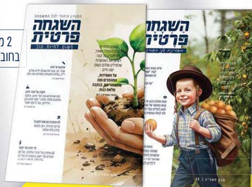
2 מגזינים בחוברת אחת