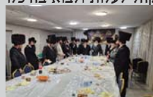
הקהל הקודש בהבדלה במוצאי שבת

המשתתפים מסרו את רשמיהם ורגשותיהם מהשהיה המרוממת בלודמיר, מתוך סיפוק רב והתעלות מיוחדת.