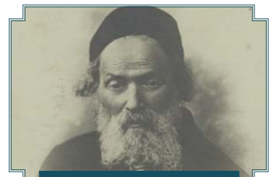
מרן הסבא קדישא החפץ חיים

סיפור זה ממחיש את הדרך המופלאה בה פועלת מערכת החסד בקהילה - כיצד כסף שמגיע כהלוואה לשמחה אחת, ממשיך הלאה ועוזר ליהודי אחר, וכיצד גלגל החסד ממשיך להסתובב